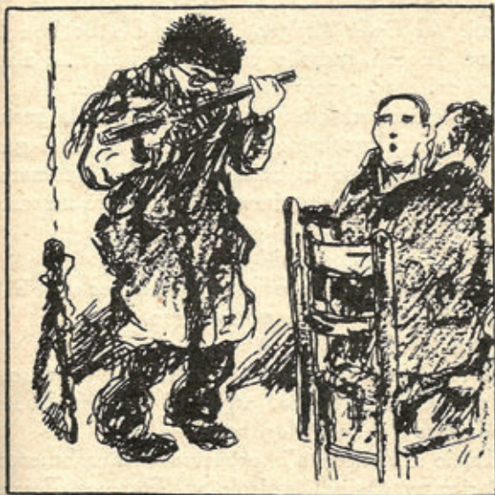
Il povero suonatore di flauto.

Già, ce Guy qui vient , come se nulla fosse scriveva, per il Travaso , una poesia ogni giorno sull'avvenimento che più l'interessava, e raramente quella poesia non era una garbatissima creazione di umorismo: lo era sempre di versi cristiani.