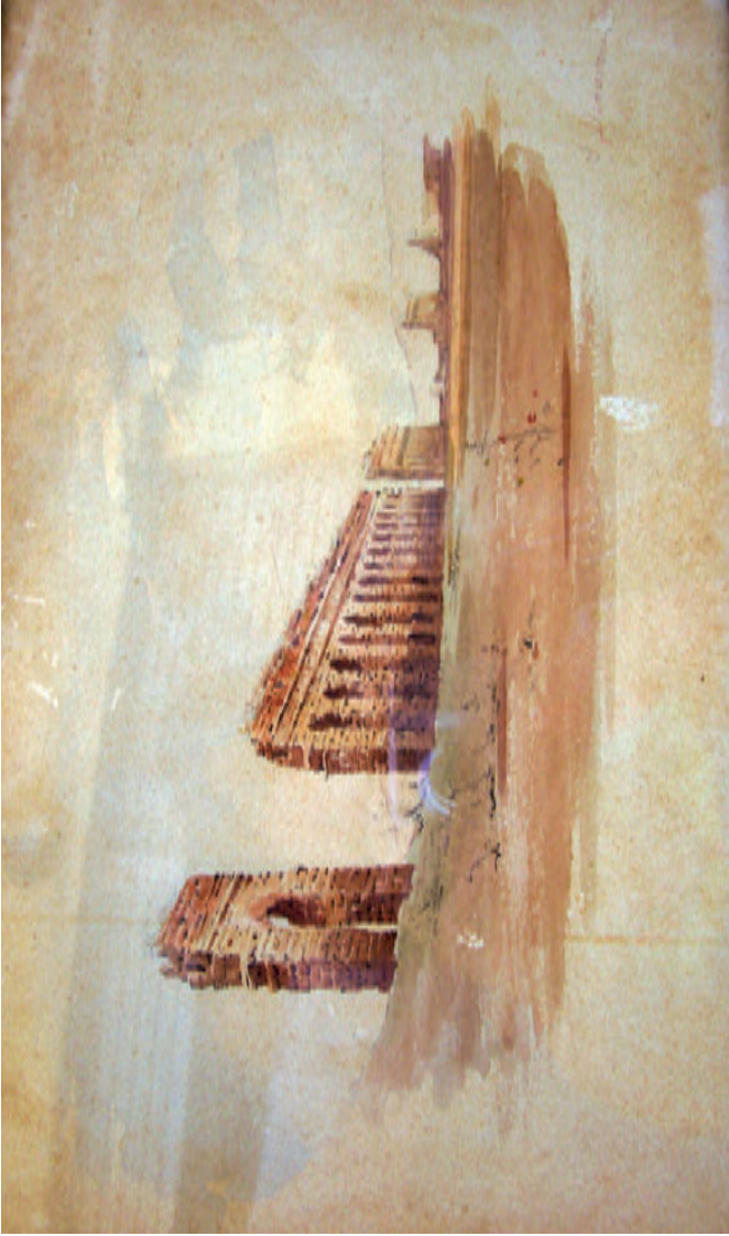
TAV. VII. Stefano Donadoni, acquerello, presso Rizzo (cap. VI).