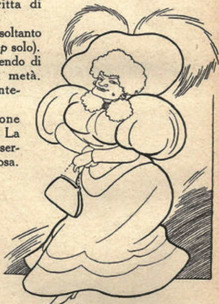
La leggiadra incognita della «Sala Umberto».

La transazione venne accettata. La lingua italiana serve a qualche cosa.