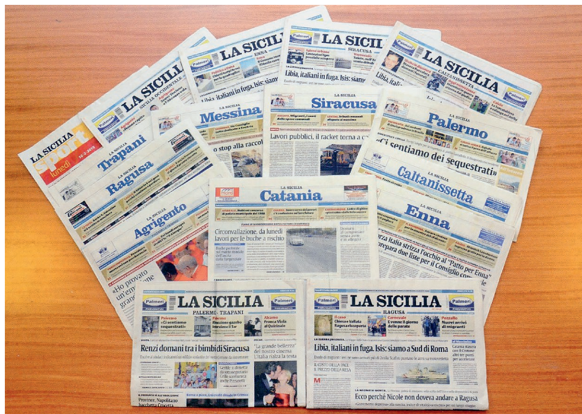
«LA SICILIA», PRIME PAGINE. IL PRIMO NUMERO DEL QUOTIDIANO PORTA LA DATA DEL 15 MARZO 1945

Data la provenienza siciliana di gran parte dei giornalisti della testata, la ricerca diventa ancora più preziosa perché consente di sag-